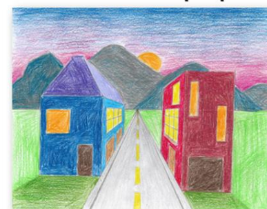
Projet d'arts plastiques